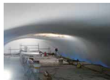
Ouvrages historiques (maçonnerie)