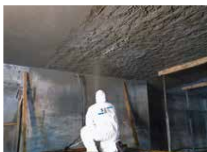
Renforcement de structures (parasismique)

Veuillez consulter notre site Web www.sp-reinforcement.eu pour plus d'informations : Références, fiches techniques, rapport de recherches, publications, documents de consultations, guides d'application. Tous nos produits sont fabriqués en Europe, dans nos usines certifiées ISO 9001.