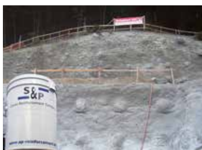
Travaux publics (talus, falaises, soutènements)