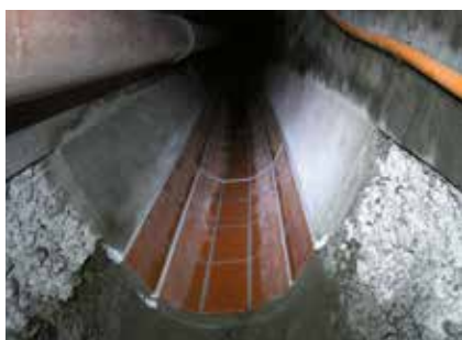
Réseaux enterrés (assainissement)