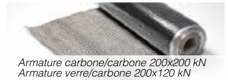
Armature carbone/carbone 200x200 kN Armature verre/carbone 200x120 kN

Pour applications courantes anti-fissuration et renforcement