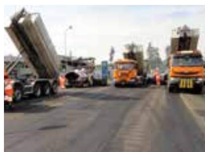
5 Application de la couche d'enrobé le même jour