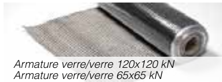
Armature verre/verre 120x120 kN Armature verre/verre 65x65 kN

Pour applications courantes anti-fissuration