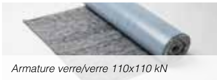
Armature verre/verre 110x110 kN

Pour une application ponctuelle anti-fissuration