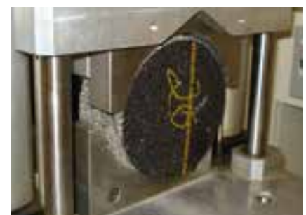
6 Assurance qualité / Essais de liaison des couches