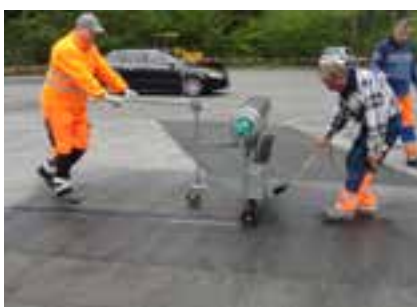
4 Application manuelle de la grille d'armature S&P pour les renforcements locaux

Veuillez consulter notre site Web www.sp-reinforcement.eu pour plus d'informations : Références, fiches techniques, rapports de recherches, publications, documents de consultation, guides d'application. Tous nos produits sont fabriqués en Europe, dans nos usines certifiées ISO 9001, suivant la norme EN 15381 et bénéficient du marquage CE.