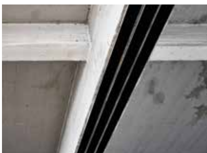
S&P C-Laminate collées en sous face (flexion en travée)