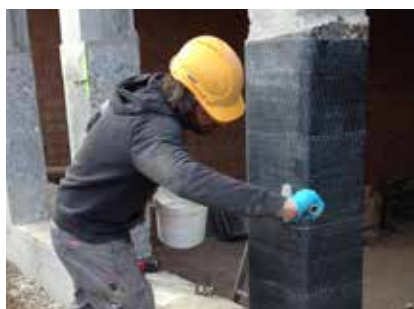
S&P C-Sheet (Pilier renforcé par confinement)