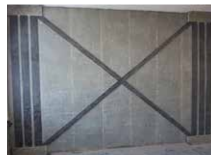
Renforcement de maçonnerie (parasismique)