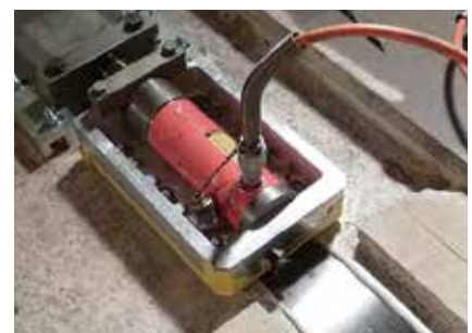
S&P C-Laminate précontraint (renfort à l'État Limite de Service)