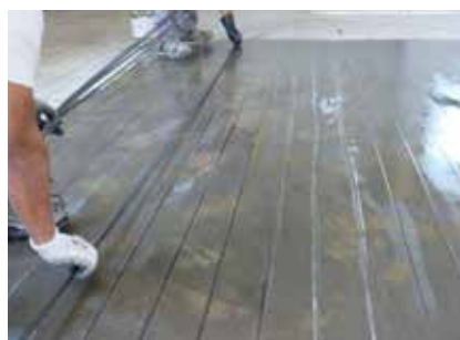
S&P C-Laminate engravées (flexion sur appui)