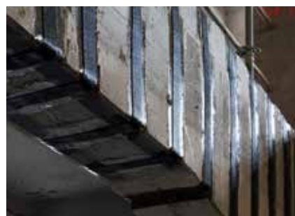
S&P C-Sheet (Poutre renforcée à l'effort tranchant)

En France, le système «FRP S&P» est sous Avis Technique CSTB (S&P C-Laminate collée ou engravée, S&P C-Sheet et les colles associées).