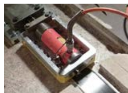
S&P C-Laminate précontraint (renfort à l'État Limite de Service)