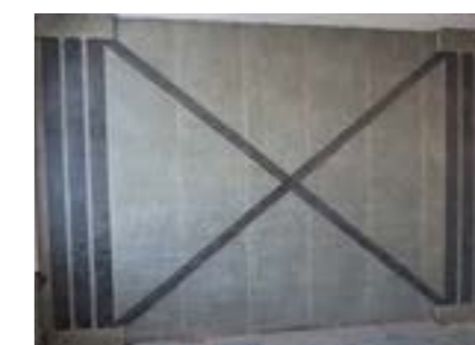
Renforcement de maçonnerie (parasismique)