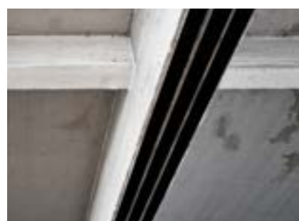
S&P C-Laminate collées en sous face (flexion en travée)