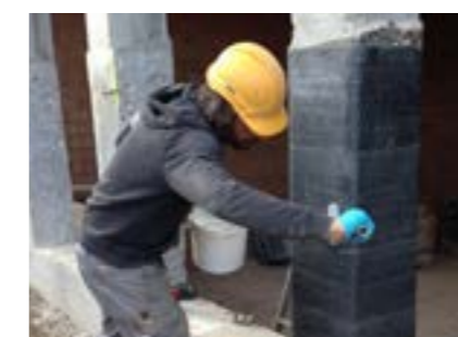
S&P C-Sheet (Pilier renforcé par confinement)