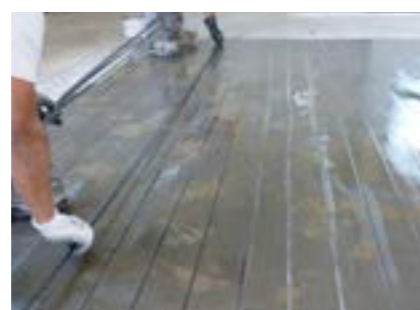
S&P C-Laminate engravées (flexion sur appui)