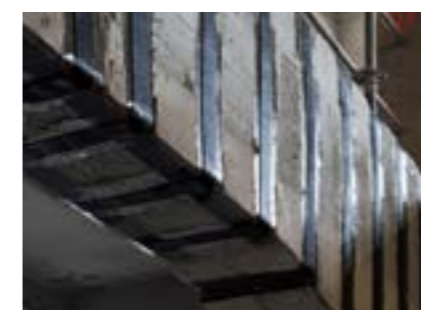
S&P C-Sheet (Poutre renforcée à l'effort tranchant)